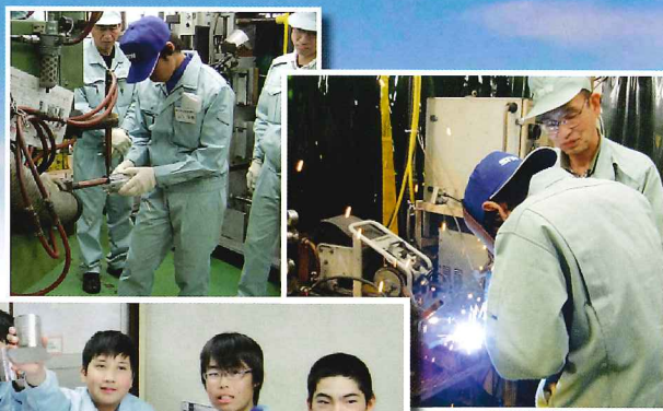
写真：機葉鉄工所での「ものづくり体験学習」風景と体験学習に参加した掛川市立東中学校3年生の生徒さん