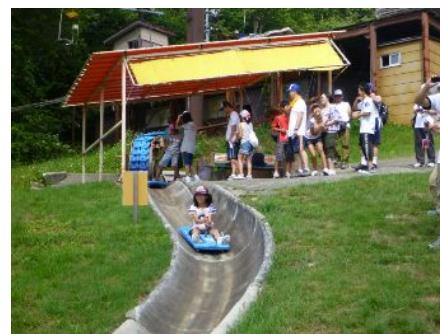
[福島バスツアーの様子]

放射線測定器・・・福島県の学校から依頼があり、平和フォーラムを通して各学校に測定器を送りました。